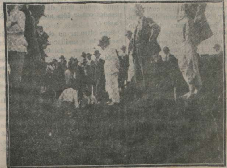
O lançamento da 1.ª pedra da estação da Paulista.

Em resposta a um telegrapho que lhe foi transmittido, o Jornal de Piracicaba, recebeu do sr. conselheiro