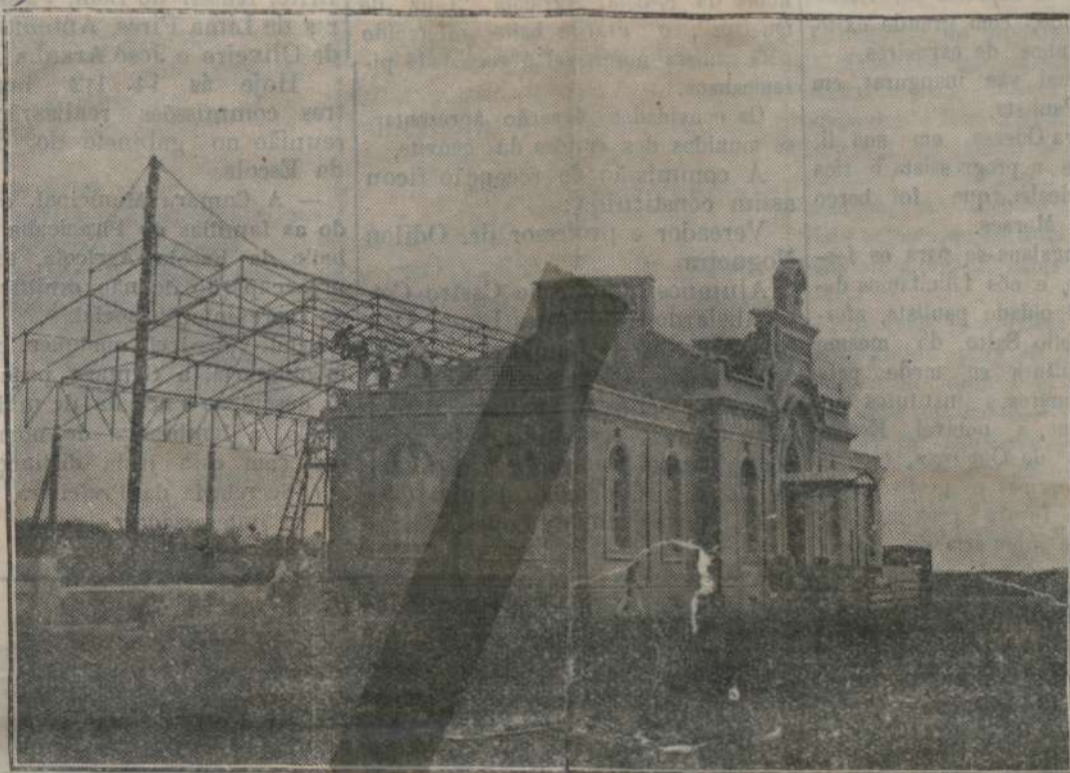
Estação da Paulista em Piracicaba, antes de ser coberta a plataforma.

A velha aspiração dos piracicabanos, que sonhavam com a ligação desta cidade ao tronco da Paulista acariciando esse sonho durante mais de quinze annos foi devido á guerra posta mais uma vez á margem e só agora, cinco annos depois de entregue ao trafego o ramal até Santa Barbara, podemos vê-la convertida em realidade.