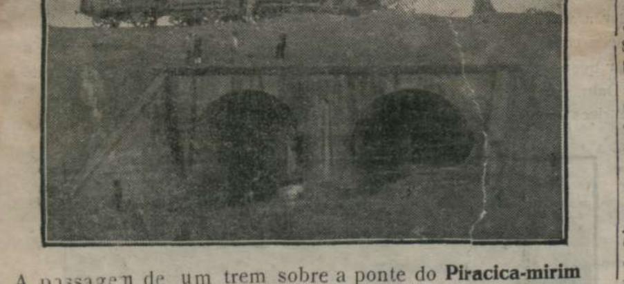
A passagem de um trem sobre a ponte do Piracica-mirim