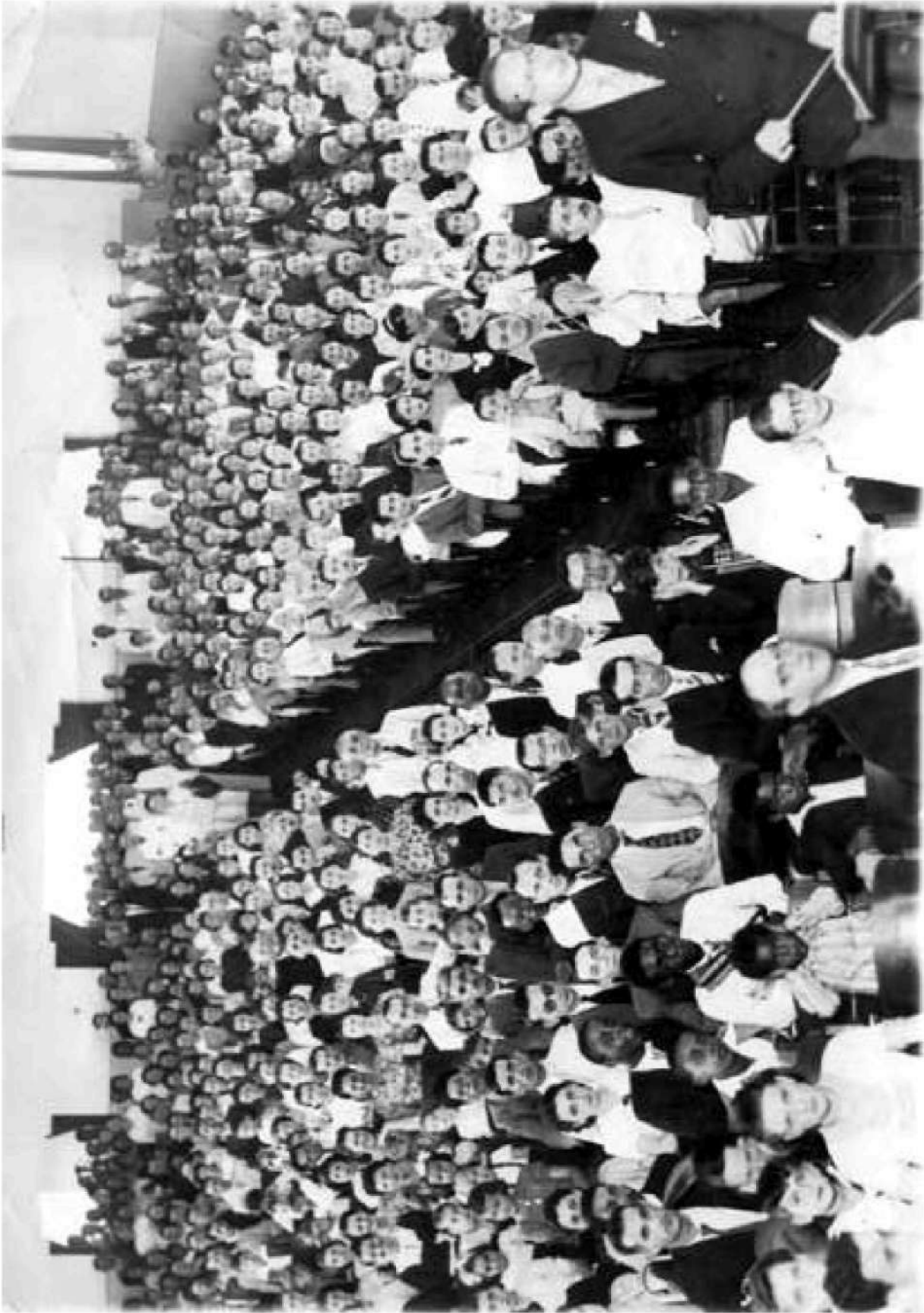
Inauguração do Cine Santa Rosa Santa Bárbara d'Oeste, 12 de fevereiro de 1939