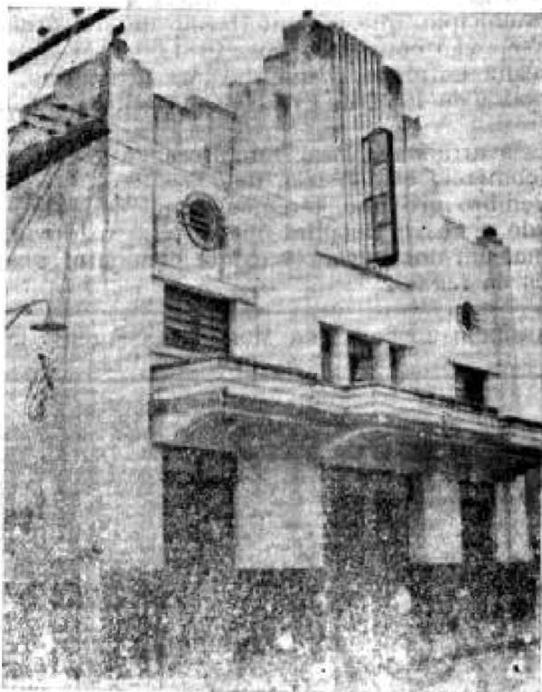
Fachada do principal cinema de Santa Bárbara D'Oeste: o Cine Santa Rosa

A Empresa Cinemas do Interior de São Paulo S. A., mantém nesta cidade, dois belos cinemas: o Cine Santa Rosa, localizado bem no centro da cidade, à rua XV de Novembro, e o Cine Monte Castelo, situado na principal Avenida de Santa Bárbara D'Oeste.