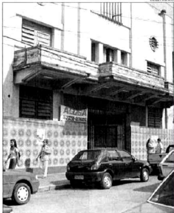
O Cine Santa Rosa fechou há 5 anos

Mas o cinema de maior destaque da cidade foi o Cine Santa Rosa, inaugurado no dia 12 de fevereiro de 1939, foi considerado na época o melhor cinema do estado, aonde além de filmes da época, costumava organizar shows com artistas do momento. O cinema que mais se preservou em Santa Bárbara ao longo dos tem-