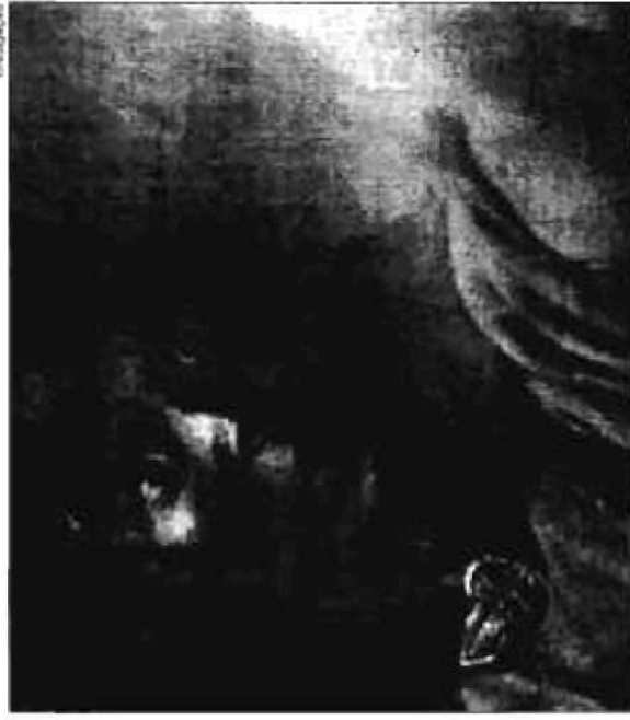
Filmes como "O Senhor dos Anéis tem atraído grande público

quanto na bombiniere. Com TVs informativas o público pode acompanhar quais filmes estão com os ingressos esgotados, os horários das sessões e outros. As filas também foram reformuladas, e as atendentes nas bilheteiras estão todas com fones de ouvido. Há também um espaço reservado para os trailers. Para informações sobre os horários das sessões, os filmes em cartaz e muito mais o Moviecom disponibiliza o site www.moviecom.com.br e ainda o e-mail tivoli@moviecom.com.br .