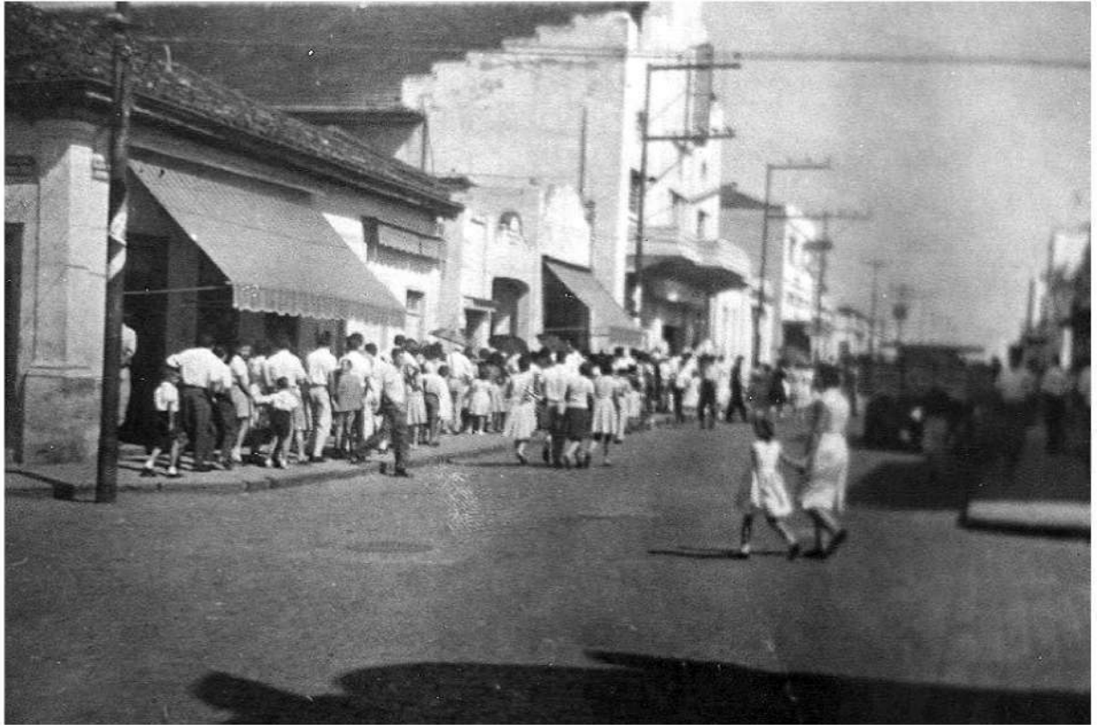
Pedro de Moraes registrou na década de 1960, a fila formada por crianças e adultos na Rua XV de Novembro, para a matinê do filme “O vendedor de Lingüiça”, com Mazzaropi, no Cine Santa Rosa.