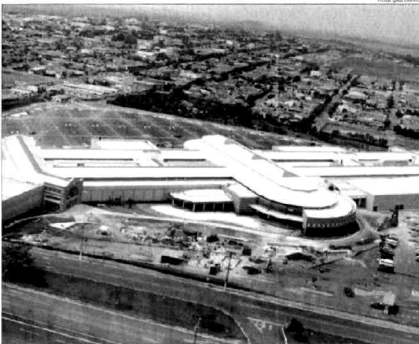
O Shopping terá salas de cinema

No início do século XIX foi inaugurado o Cine Iris Teatro que ao longo do tempo foi sen-