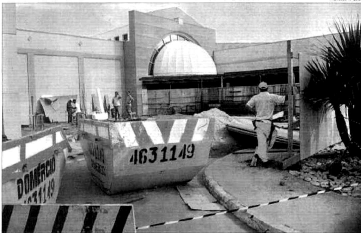
Tivoli terá mais uma sala de cinema

Conforme revelou o supervisor, a nova sala irá seguir o padrão das outras que é de última geração. A sala contará com encosto para cabeça, porta co-