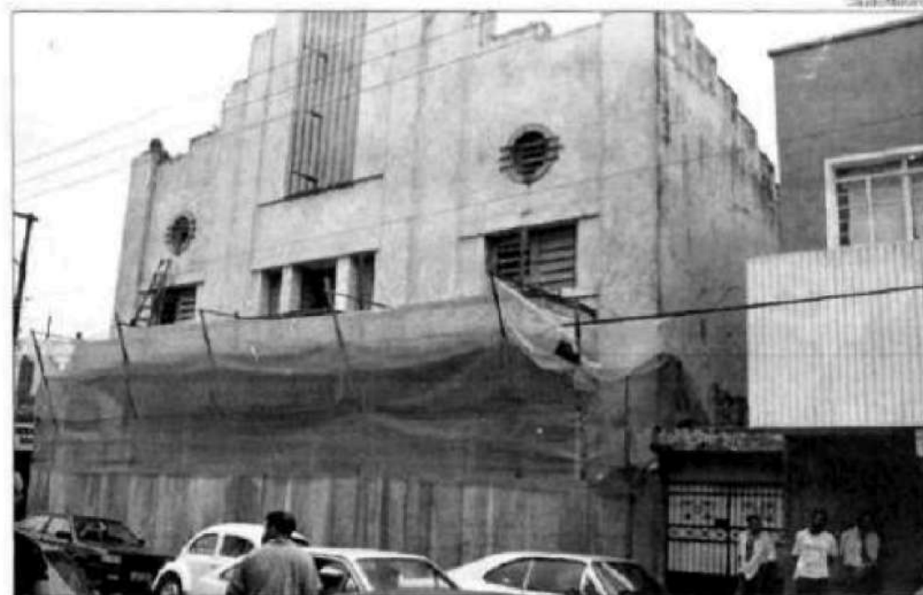
O prédio está sendo reformado

E quanto à duração do contrato da Igreja com a imobiliária o pastor comentou: "Para nós a mudança é para sempre. Sair dali só se for para um lugar muito melhor". Um caso interessante mencionado pelo pastor é a existência de uma inscrição no local datada de 28/03/39 com os dizeres: Teatro Universal e que, segundo ele, após 60 anos agora se concretiza uma coisa que parece uma coincidência, mas que já estava determinado por Deus.