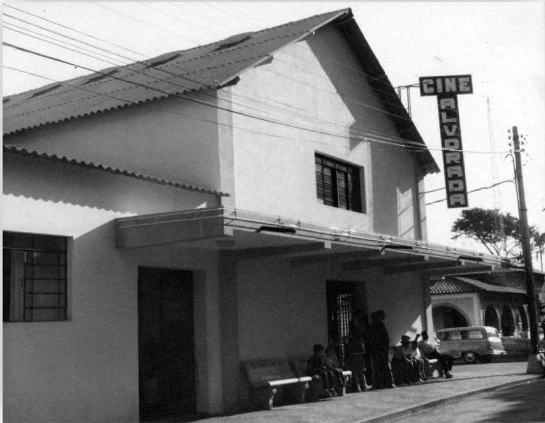
Usina de Cillo, maio de 1964