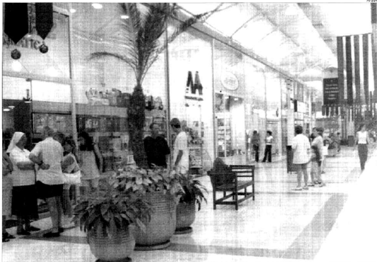
Tivoli Shopping está completando 4 anos

Neste mês de novembro, o Tivoli Shopping está completando 4 anos e se consolidando como um marco no varejo da região e a meta de ocupação atingida pela sua superintendência. Apenas 1,6% da área locável está disponível atualmente, o equivalente a uma média de oito lojas. Ao todo o empreendimento oferece 157 operações.