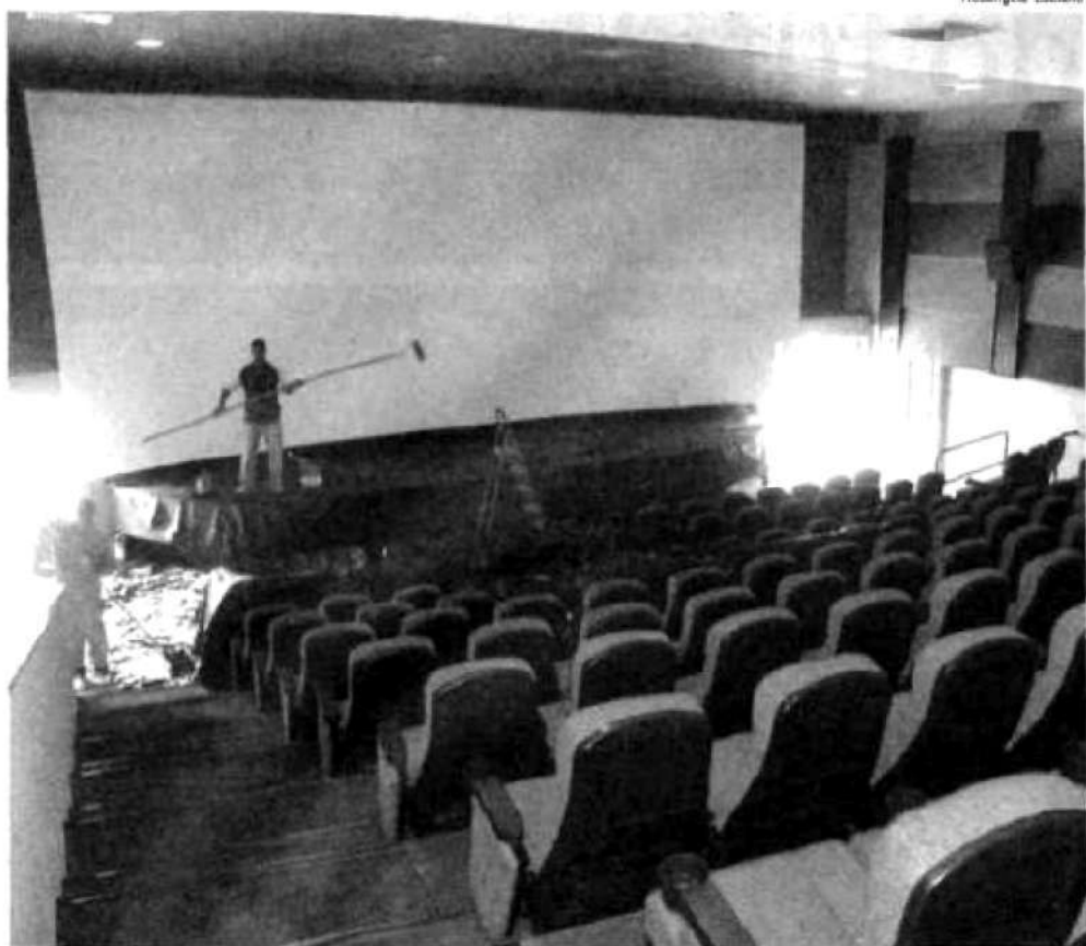
Reforma no Moviecom está sendo concluída